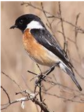
Traquet pâtre mâle