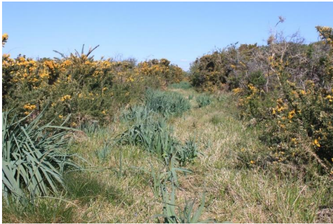
Layon sur la Butte de Beg Er Lann