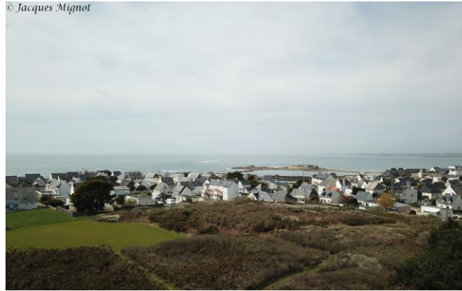
Vue du ciel.