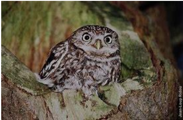
Chouette chevêche (protégée)