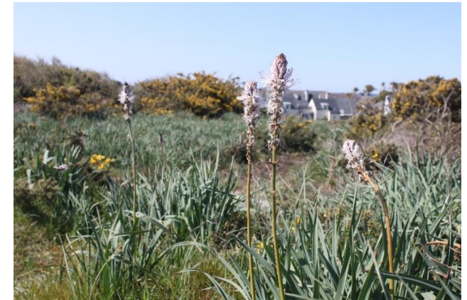
Asphodèle sur la Butte de Beg Er Lann