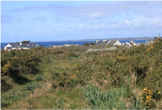
Butte de Beg Er Lann