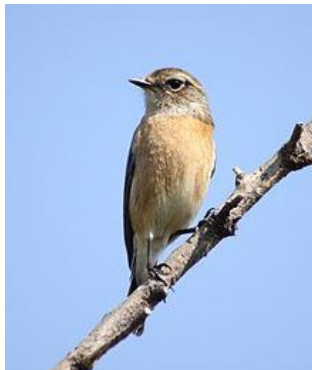
Traquet pâtre femelle